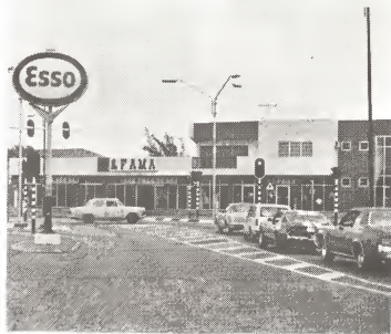
E problema di trafico, principalmente den e skinan di caya di Oranjestad a wordo resolvi cu instalacion di luznan di trafico. Gobierno di Aruba lo bai laga haci un estudio riba Aruba pa determina na ki otro puntonan lo mester bini luznan di trafico.